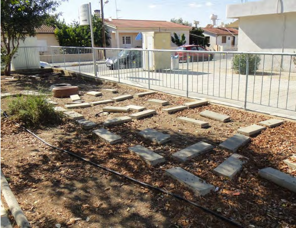
Πριν την παρέμβαση