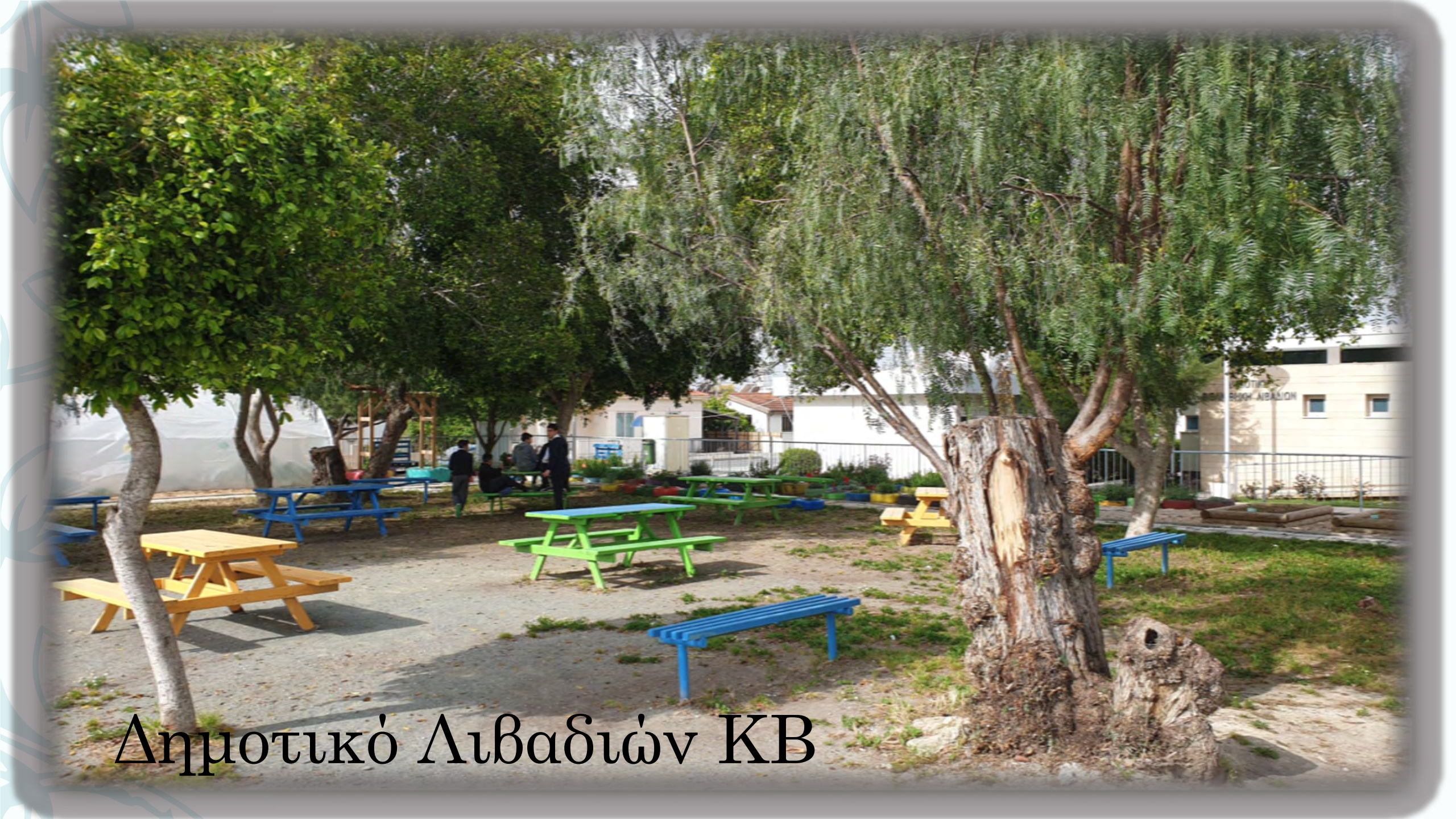
Δημοτικό Λιβαδιών ΚΒ